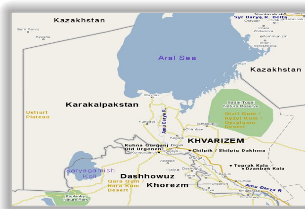
تصویر شماره ۲: http://www.heritageinstitute.com/zoroastrianism/ khvarizem