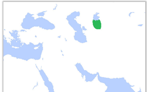
تصویر شماره ۱: http://en.wikipedia.org/wiki/File:AfrighidsMap.png

در قرن دوازدهم میلادی گرگانج به عنوان پایتخت سلاله مقتدر خوارزمشاهیان اهمیت تازه‌ای پیدا کرد و چون سلاله مزبور در جهان اسلام به منزلت بزرگترین خاندان سلطنتی ارتقاء یافت، تخت‌گاه آن نیز می‌بایست با گنجینه‌های همه سرزمین‌های گشوده شده توانگر شود (۶). یاقوت حموی که در پایان سال ۱۲۱۹ و آغاز سال ۱۲۲۰ میلادی در گرگانج پیش از حمله مغول بوده، معتقد است که آن شهر وسیع‌ترین و غنی‌ترین شهر است که وی دیده است (تصویر شماره ۱ و ۲) (۷).